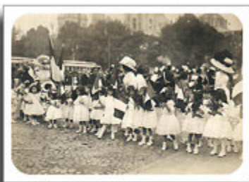
Festejos del Centenario

Los niños empezaron a ser "visibles" a partir de las fiestas del Centenario. Fue entonces cuando, por medio de las fotografías, vemos a las maestras muy bien ataviadas, con bellos vestidos y grandes sombreros y, a su lado, desfilaban algunas pequeñas vestidas de blanco..