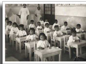
Kindergarten de la Fabrica Nacional de Vestuario y Equipo

Estas materias eran cursadas por las maestras que querían dedicarse a instruir a los párvulos. La carrera duraba tres años y el programa lo establecía el director de la Escuela Normal de Profesores, con la aprobación del Ministerio de Justicia e Instrucción Pública,