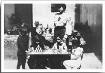
Maestra de Párvulos

Muchas historias de niños, al igual que muchas de mujeres, todavía esperan al investigador que se interese en ellas. La historia del