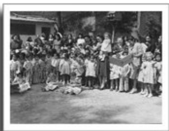
Grupo de Maestras y alumnos de Preescolar. 1942.

Este primer esfuerzo continuó gracias a la constante labor de las madres de familia, quienes siempre se preocuparon por la mayor eficacia de la educación en los jardines de niños. El resultado fue que los planteles aumentaron a 1 132 en todo el país. Incluso, en 1957, se celebró en México el Congreso de la Organización Mundial para la Educación Preescolar (OMEP) N .