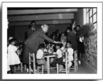
Rosaura Zapata visita Jardín de Niños Ricardo Castro, AHSEP, 1952.

En 1908, en la Ley Constitutiva de las Escuelas Normales Primarias, se consignaba la carrera de "educadoras de párvulos". Se decía lo siguiente: "En la escuela normal primaria para maestras se preparará la formación de educadoras de párvulos. Al efecto, se modificará para ellas el plan indicado en artículos anteriores de modo que comprenda el conocimiento práctico y teórico de los kindergarten." N