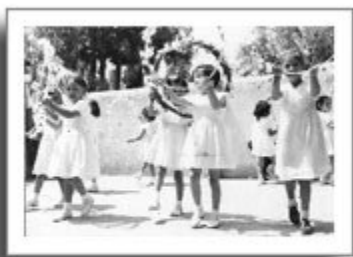
Jardín de Niños Ricardo Castro, AHSEP, 1952.

Para lograr lo anterior se insistía en la observación de la naturaleza y el amor a ella. Se tendrían que desarrollar los "juegos" que jugaban en la casa con sus madres y otros parecidos" Se insistía también en realizar marchas, rondas y ejercicios rítmicos. Los cuentos y la observación de estampas tenían un papel muy importante en la educación de los párvulos. Se sugerían trabajos en arena y el cuidado de animales, cuando fuera posible. Los jardines, entonces, admitirían a niños de tres a seis años de edad y serían mixtos.