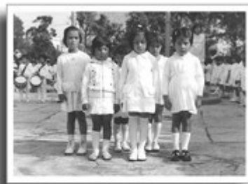
Actividades en un Jardín de Niños de la década de los ochenta. 1980.

El progreso cuantitativo fue mínimo ya que de 2 324 planteles que había en el sexenio anterior, tan sólo aumentaron a 3 164 durante el gobierno de Díaz Ordáz, incremento insuficiente, ya que cada vez la población escolar aumentaba así como el número de madres que salían a trabajar N .