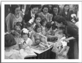
Los Niños y sus libros en el Preescolar, AHSEP 1942.

Posteriormente, en 1931, se elevó la Inspección General de Jardines de Niños al rango de Dirección General. Al buscar la democratización de estas escuelas, algunas se establecieron en los barrios más pobres de la ciudad. Por otro lado, también se fundaron ocho jardines anexos a las escuelas normales rurales N .