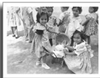
Festejo del Día del Niño, AHSEP. 1942.