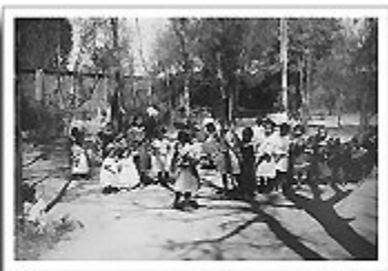
Niñas Jugando a San Miguelito